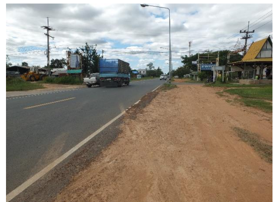
ถนนหลวง รพช. เป็นเส้นทางคมนาคมที่สำคัญที่ใช้สัญจร ระหว่างตำบลสระแก้ว และตำบลนมไพร